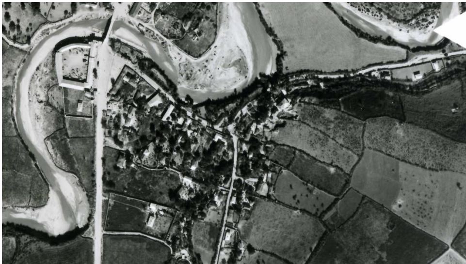
عکس هوایی از محله پل سر سال ۱۳۳۵

رودی به همین نام در چهار فرسنگی ساری و دو فرسنگی قره‌تپه و سه فرسنگ از ساحل دریا» (ملگونوف، ۱۳۷۹: ۲۱۲). اهمیت تاریخی نکا هم به واسطه همین پل بود. در روایت‌های شفاهی نیز از این محله با نام پلِ سرِ یاد می‌شود. بعدها با گسترش محله و به دلیل منتهی شدن مسیر به روستای کلبستون و جنگل به «کلبستون‌راه»، «خیابان کلبستون» و «خیابان جنگل» معروف شد. پس از تأسیس