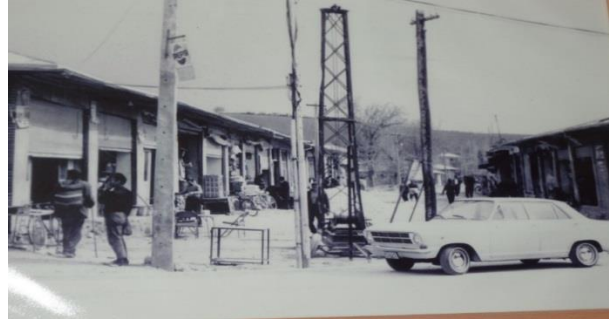
پل سر، ابتدای خیابان علمیه در دهه پنجاه

احداث شد. این میدان در گذشته دارای نماد لاله بود که بعدها این نماد جابه‌جا شد. اکنون این میدان المانی ندارد و شهرداری فضای آن را با توجه به هرفصل گل‌کاری می‌کند.