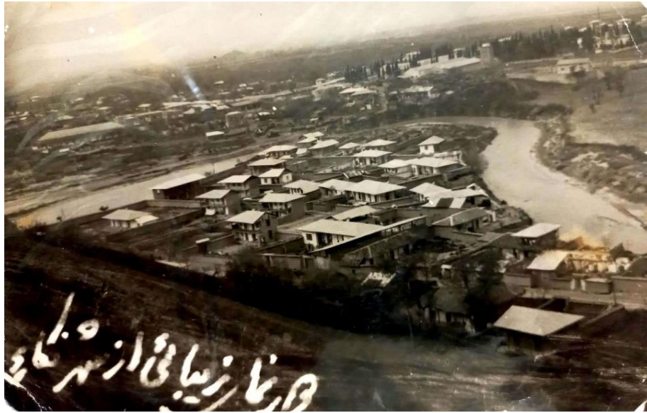
نمایی از خیابان علمیه در دهه پنجاه که امروزه به پارک و مقبره شهدای گمنام تبدیل شده است

اجتماعی، فرهنگی و زیست‌محیطی نیز کم‌کم پوست‌اندازی کرد. پلان خانه‌های روستایی با چهار یا دو اتاق بود که یک راهرو در وسط قرار داشت. سقف آنها شیروانی (غالباً به صورت شیب چهار طرفه) و پوشیده از سفال بود. عمده مصالح آن آجر و چوب بود. چهار طرف بنا دارای پنجره‌های شیشه‌ای و ایوان و بالکن سرپوشیده و سرتاسری رو به خیابان بود. طبقه همکف ساختمان‌های روستایی چسبیده به هم در گستره پل سر تا چهارراه، به عنوان دکان (املاکی دکن: مغازه املاکی) استفاده شدند و اتاق‌های طبقه اول، کاربری اداری یا تجاری (مهمان‌پذیر) یافتند. خانه‌های روستایی مورد استقبال مهاجران و افرادی قرار گرفت که سرمایه کافی برای خریدن ملک و ساخت خانه نداشتند.