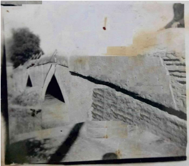
پل نکا در اواسط دهه ۳۰

پل شاه‌عباسی در دههٔ چهل با دینامیت تخریب و پل بتنی دیگری بر جای آن ساخته شد. بعد از طغیان نکارود و سیل ویرانگر پنجم مردادماه ۱۳۷۸ بخش‌های اصلی پل دههٔ چهل نیز تخریب و پل جدید بنا شد. این پل دارای چهار پایه سنگی بزرگ است. طولی بیش از ۵۰ متر و ارتفاع ۷ متر و پهنایی به اندازهٔ ۳۰ متر دارد. پس از سیل سال ۱۳۷۸ و به دنبال مرمت پل در دو طرف آن، دو پل فلزی عابر پیاده معلق نیز نصب شده است.