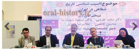
Pathology of Oral History in Iran