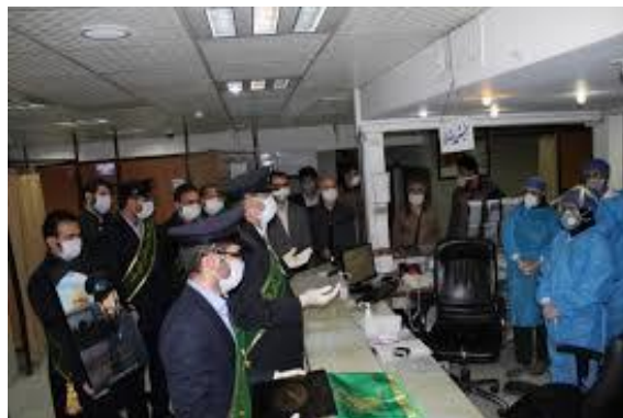
بازدید خدام آستان قدس و دیدار با کادر درمان